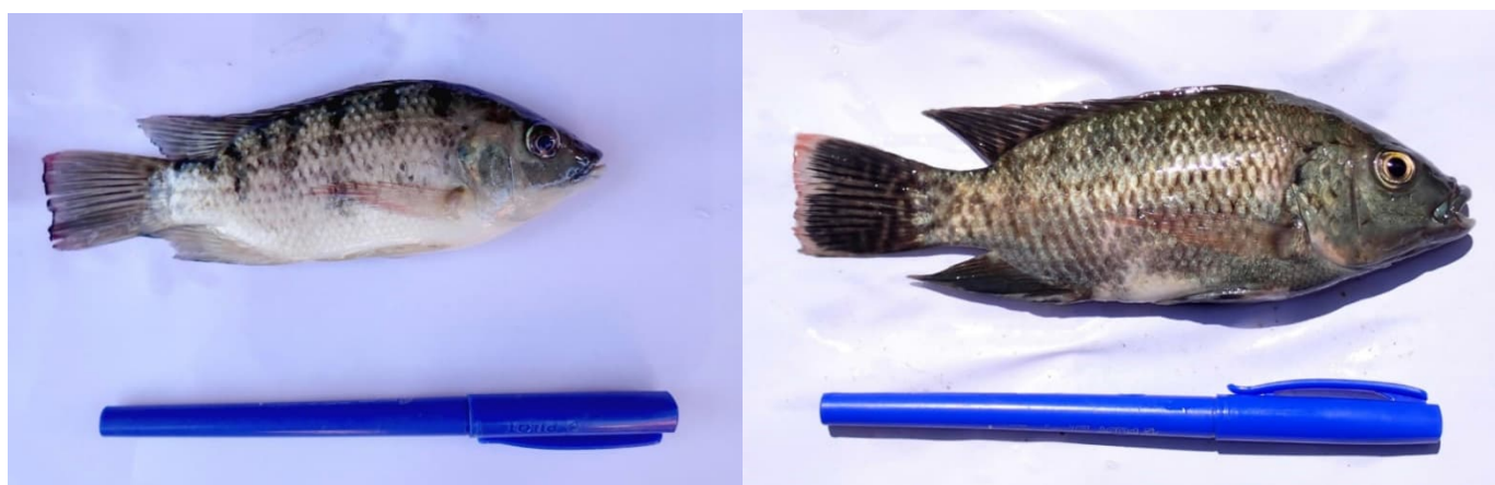
Figure 3. Oreochromis mossambicus (Rasoamihaingo, 2022)

C'est dans ce contexte que le présent document propose un plan de repêchage afin de restaurer et d'améliorer les conditions écologiques de l'eau et de la végétation du lac Sofia ainsi que la dynamique de l'écosystème entier et par la suite améliorer et augmenter le revenu des populations locales dépendant directement (pêche, artisanat à base de papyrus etc.) ou indirectement (irrigation agricole etc.) du lac Sofia.