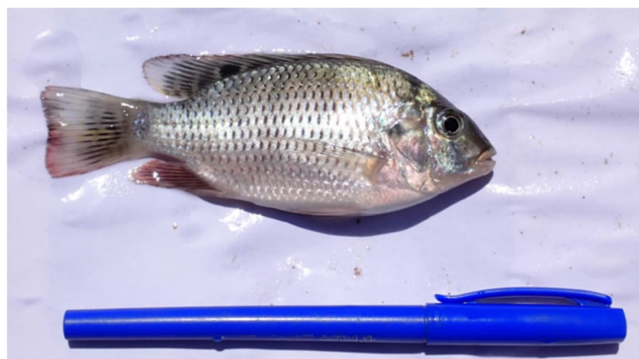
Figure 2. Coptodon rellandi (Rasoamihaingo, 2022)